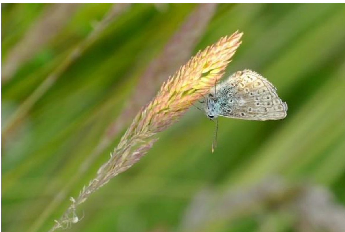
Het icarusblauwtje liet zich graag bewonderen