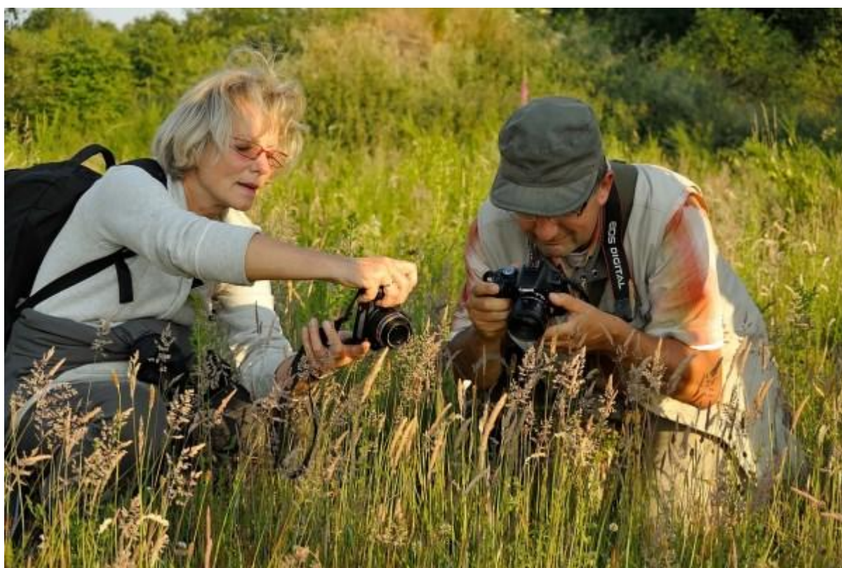
en dat hadden enkele slobkousjes snel begrepen