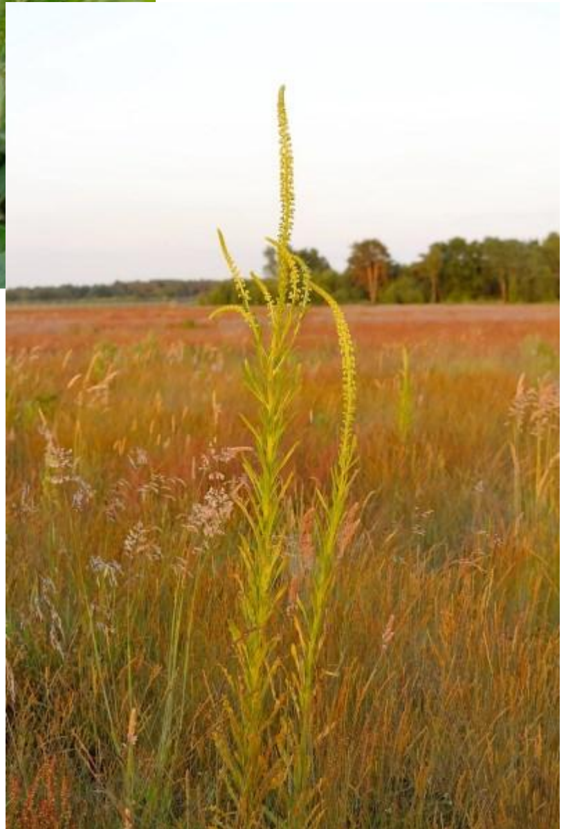
wouw (voor alle duidelijkheid dit is niet als uitroep bedoeld maar de naam van deze plant!)